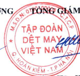
Cao Hữu Hiếu