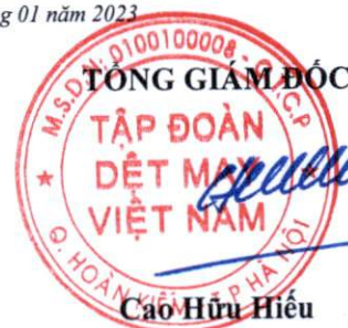
Cao Hữu Hiếu