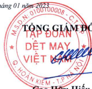
Cao Hữu Hiếu